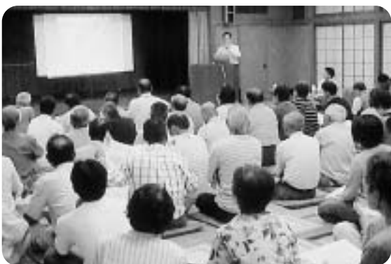
地域住民防災懇談会を開催