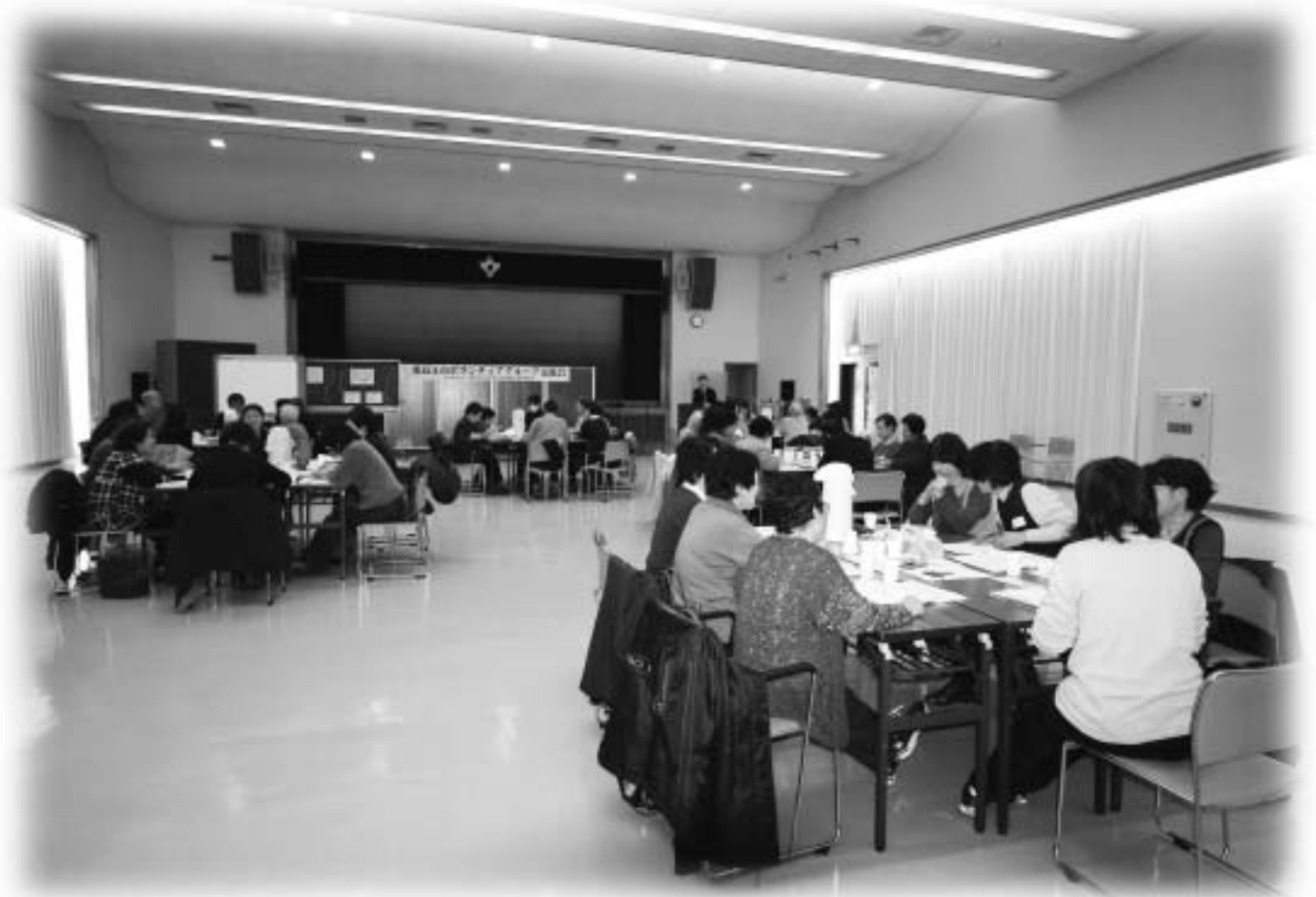
東近江市ボランティアグループ交流会 2月26日(木) 湖東公民館