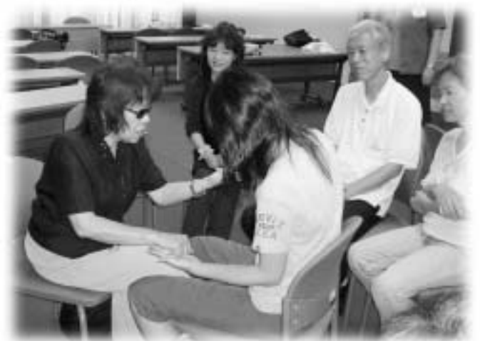
ジャンケンゲーム

8月6日(木)に能登川公民館で「盲ろう者と交流しよう」と、住民と盲ろう者の交流会が開催されました。目と耳に障がいのある人のことを「盲ろう者」といいます。手のひらに指でひらがな、カタカナ、漢字を一字ずつ書きながらコミュニケーションをとりました。手話のできる人は、手話の形を触ってコミュニケーションをとりました。盲ろう者の方々からは、「目と耳に障がいを持ち、景色や音楽を楽しめないことも悲しいが、人との交流やコミュニケーションを絶たれたことが一番の悲しみ。」また、「まだまだ盲ろうの人たちは家に閉じこもっているはず。もし近所に盲ろう者がおられたら、私たちに知らせてほしい。少しでも交流して生きる喜びを取り戻してほしい。」交流会での印象的な言葉でした。