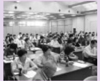
児童福祉部会 講演研修会の様子