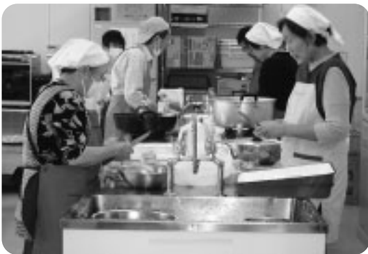
見守り訪問活動 父子家庭給食づくり

民生委員児童委員は3年に一度、12月1日という本場に慌ただしい時期に委嘱を受けます。特に新人委員の私は、研修もそこそこの地域を駆けずりまわり、「これで活動目的が達成できているのだろうか?」「と思いつつ住民の皆さんからの相談活動をしました。職務遂行するにあたっては、相談される方々のプライバシーに触れることが多いため、秘密を守ることが法により義務付けられています。