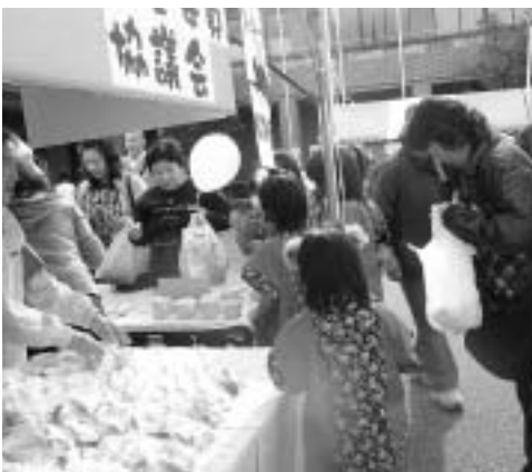
（右）：「いきいきあかねフェア」での手作りのクッキーとホクホク焼き芋の販売 （下）：グループホームへの訪問

また、災害時要援護者避難支援制度により、地域での防災体制の一翼を担う勉強や訪問活動も実施しています。