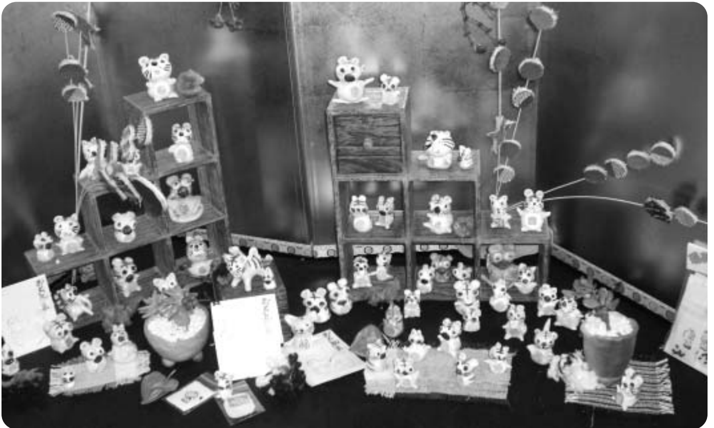
滋賀県立八日市養護学校高等部作業学習作品（陶芸班、さをり織り班、紙工班の合作）