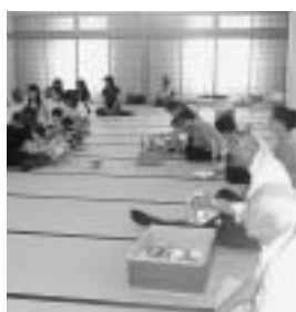
（下）…月1回の「お出かけ保育」のお手伝い