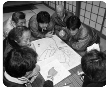
▲防災マップづくり