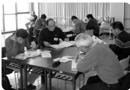
▲退職シニア地域デビュー講座