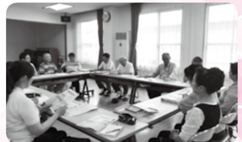
地区計画推進会議