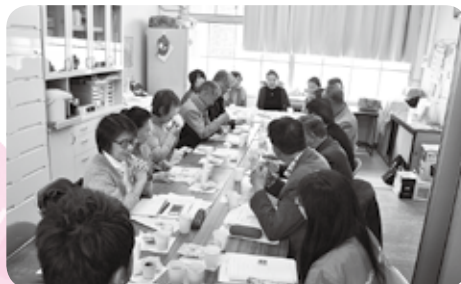
地区ボランティアセンター設立に向けた視察