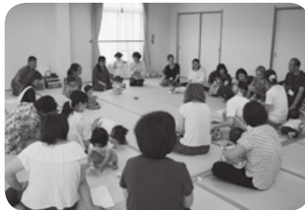
ほっとたいむ (にここへ訪問した1歳半～2歳までの赤ちゃんとお母さん同士のつどいの場)