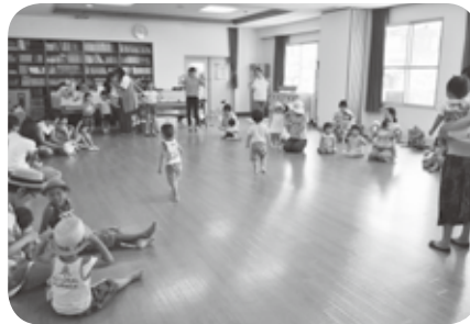
親子ふれあい広場