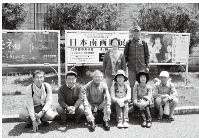
1期生 遊歩会 「京都歩き」