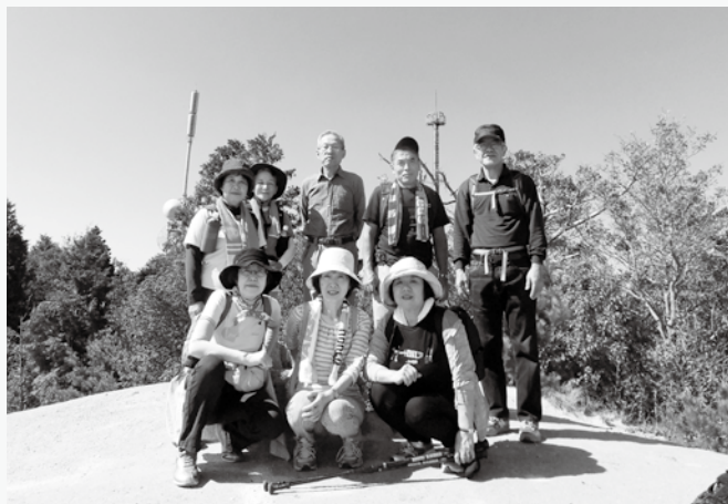
9期生 九会 「山登り」