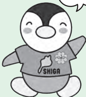
滋賀県民生委員・児童委員キャラクター 「びわっ湖 ミンジー」