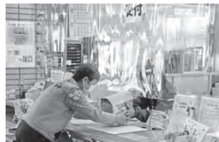
社協窓口にて「地域活動応援BOX」の受け渡し