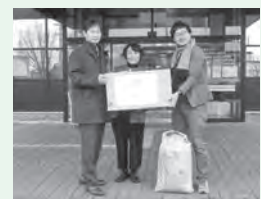
連合滋賀第4区地域協議会様より、お米と非常食をご寄付いただきました