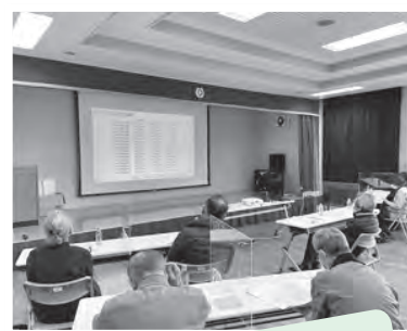
リモート研修の様子

民生委員2年目の活動目標は、先に五個荘地区で配布されている「命のバトン」の用紙に「お薬手帳」等の内容が記載されているか声かけに伺い、 お一人おひとりに寄り添って活動 をすることです。訪問時は対面ではなくて、横並びでお話しをお聞きします。長居は避けて、屋外空間で気持ちよく対話するときもあります。私たち民生委員・児童委員を「いいおしゃべり相手」にしてください。今後ともよろしくお願ひします。