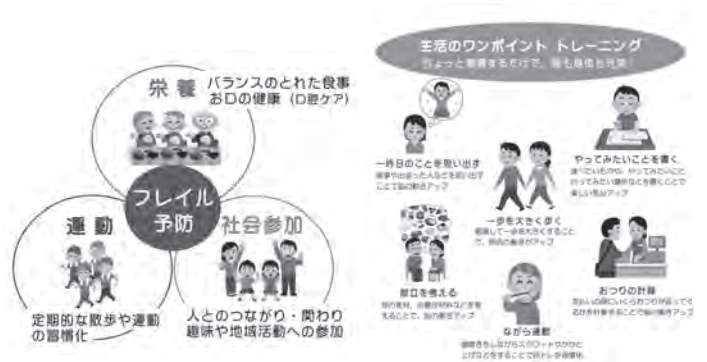
▲「コロナに負けるな! レッツ! チャレンジ! フレイル予防」より

また、フレイルを予防するためには、食事も大切になってきます。管理栄養士の監修を受け作成した「おいしく食べてフレイル予防」では、食事・栄養面から、フレイル予防についてまとめています。食事は、活力の源です。ぜひ参考にしていただき、コロナにも負けない身体づくりをしましょう。