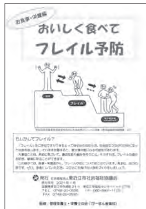
▲「おいしく食べてフレイル予防」より